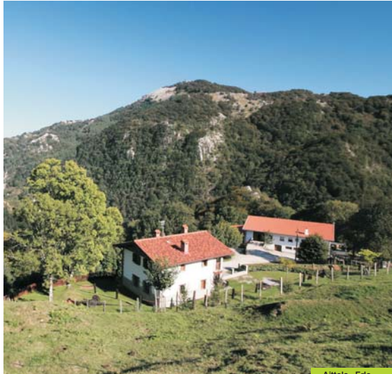
Aittola - Erlo