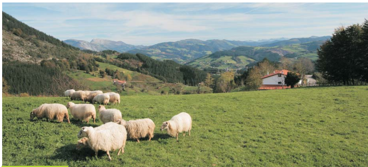
Aritza baserria - Caserío Aritza

Ibilbidearen hasieran, gora egin behar da etengabe eta luzaroan, landalurretan barrena hasiera batean eta mendi-mendian ondoren. Ibilbidearen zatirik latzena da, eta bi ordu inguru behar dira Itziar eta Azkarate zein Azkoitia lotzen dituen errepidera iristeko; bertan, landareidiaren aldaketa nabarmena antzematen da berehala, pagadi handiak eta kanpotik ekarritako beste espezie batzuen baso zabalak (besteak beste, pinudiak eta lariztiak) baitaude Izarraizko goiko aldean. Bideari jarraiki, Marikutz putzura helduko gara, 700 metroko garaieran dagoena ia: kondairak dioenez, Mari bertan murgiltzen zen, eta urruneko beste mendi batzuetan agertu. Inguru honetan, bideak errepidearekin bat egiten du une batez, eta Aittolako atsedenlekura heltzen da laster. Bertan, aparkalekutik hurbil, bidearen jarraipena adierazten duen gezia bilatu behar da, beheerantz, Goltzibarrerantz egiten duen bidexka markatzen duena. Haranaren beheko alderainoko jaitsiera nahiko maldatsua da eta, Goltzibarreko erreka heldu ostean, aurrera egin behar da bailararen beheko aldean barrena, bukaeraraino. Ibilbidearen amaiera aldean, bidetik nahiko hurbil, Ekaingo haitzuloa dago, eta amaiera baino pixka bat lehenago, berriz, Lili jauregia, XV.-XVI. mendeetako eraikin itzela. Zestoa bertantxe dago.